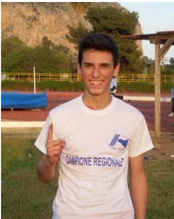
Campionati Regionali ALLIEVI Prove Multiple – PALERMO

Nel 2015, nella competizione su Strada Provinciale Filippo si aggiudica entrambe le sessioni del del Circuito Diadora, ma è a livello Regionale che bisogna puntare se si vuole ambire a qualche risultato di prestigio. E seppure di primo anno nella Categoria, arrivano anche i risultati nelle Prove Multiple. Oltre a delle vittorie in Manifestazioni OPEN su Pista in gare Provinciali e Regionali