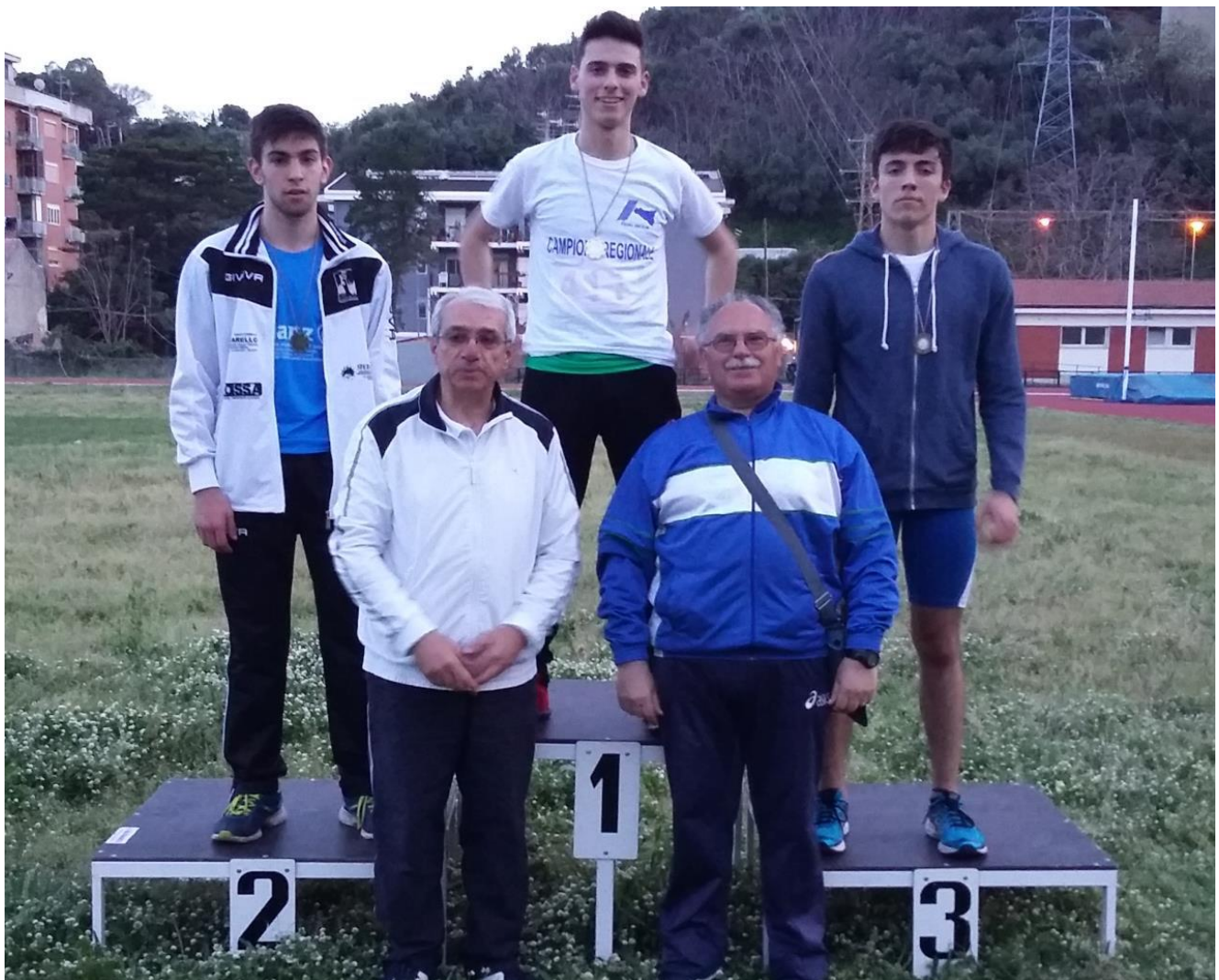
Campionati Regionali Prove Multiple - MESSINA

Minimo A ottenuto con 4850 Punti e Titolo vinto, per la gioia di entrambi, Tecnico e Atleta.