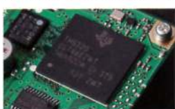
32-bit High Speed Floating Point DSP

Il DSP in virgola mobile ad elevata velocità a 32 bit (max. 3000 MIPS) consente l'efficace cancellazione/riduzione (DNR) del rumore casuale che disturba frequentemente le frequenze HF. Inoltre: AUTO NOTCH (DNF) elimina automaticamente il tono dominante dei battimenti. CONTOUR e APF sono strumenti molto efficaci per la riduzione del rumore nel ricevitore nel funzionamento nelle bande di frequenza HF. Sono presenti l'originale QRM DSP YAESU e funzioni per la riduzione del rumore.