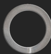
BR23 6.4G Ø26.5