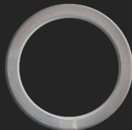
BR29 12G Ø33.7