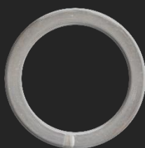
BR21 5.2G Ø25.8