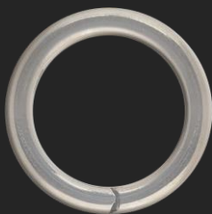
BR25 10.1G Ø30.1