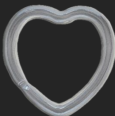
BR15 8.5G H30.5