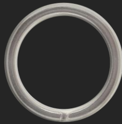
BR4 8.5G Ø32.2