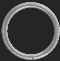
BR12 6G Ø27.5