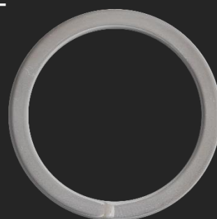
BR26 14.5G Ø40