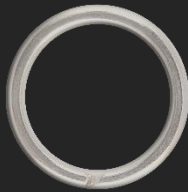
BR5 3.8G Ø24