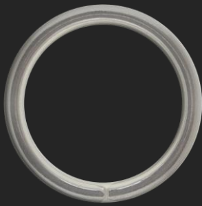
BR10 11.5G Ø38.4

SCALA 1:1 - RIFERIMENTO PESO: ARGENTO (ALTRI MATERIALI DISPONIBILI)