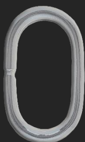
BR17 7.5G H36.3