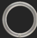
BR6 2.7G Ø19.2