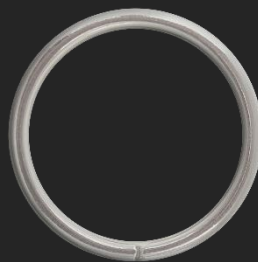
BR3 5.7G Ø33.8