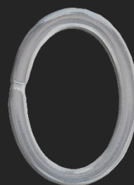
BR16 8G H33.6