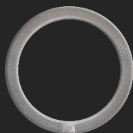
BR22 3.7G Ø24.2