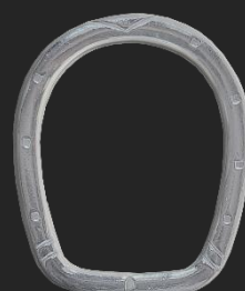
BR9 8G H33.7