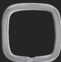
BR8 7.4G H27.5