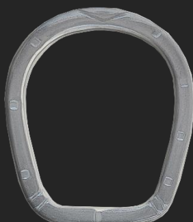
BR18 11G H42.2