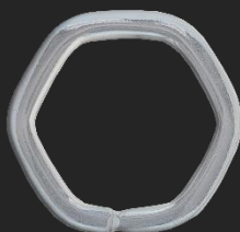
BR7 6.7G H27.3