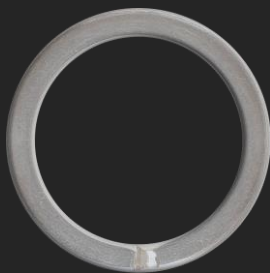
BR20 12G Ø34.8

SCALA 1:1 - RIFERIMENTO PESO: ARGENTO (ALTRI MATERIALI DISPONIBILI)