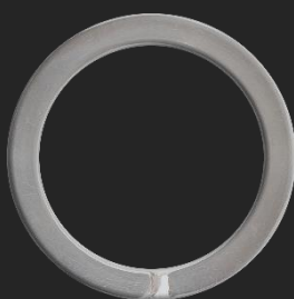
BR24 8.6G Ø34