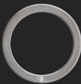
BR19 9G Ø34