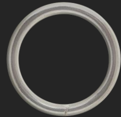
BR11 6.7G Ø30.6