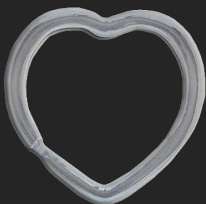
BR14 10.5G H36.6

SCALA 1:1 - RIFERIMENTO PESO: ARGENTO (ALTRI MATERIALI DISPONIBILI)