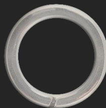
BR28 7.5G Ø27.7