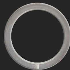
BR1 6.7G Ø30.8