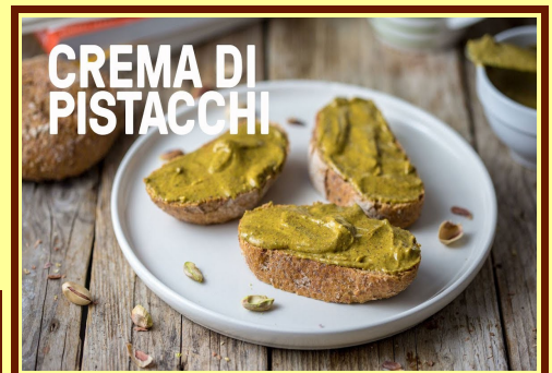
Paste di mandorla e di pistacchio