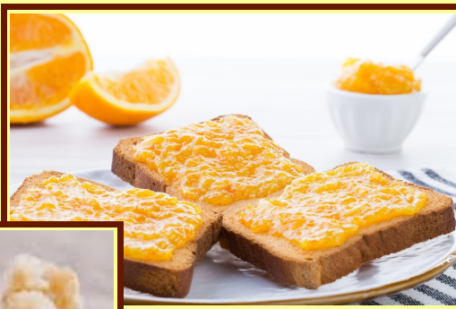
Marmellate di agrumi siciliani