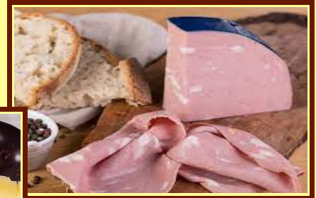
Mortadella di bufalo