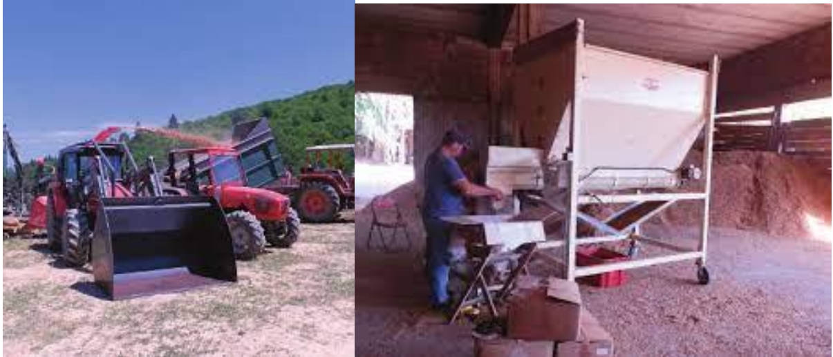
Sistemas de producción. Pala cargadora y criba para limpieza y afino de la microastilla.