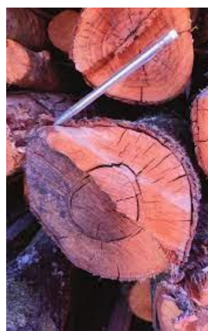
Detalle de la madera y de la microastilla generada