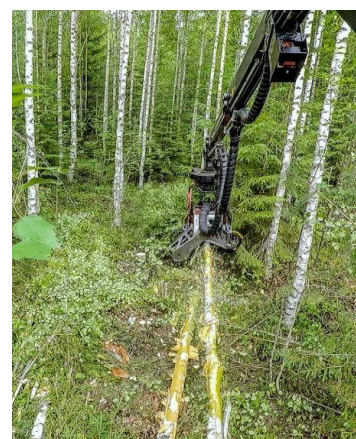
En el estudio de Nuutinen et al. (2021), pasillo de aclareo con agrupamiento de madera para energía