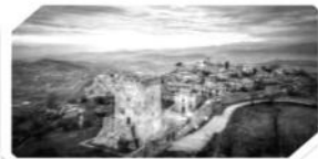
ARPINO E LE SUE MURA CICLOPICHE