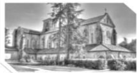
LA SUGGESTIVA ABBAZIA DI CASAMARI