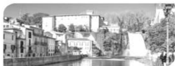
ISOLA LIRI CON LE SUE CASCADE