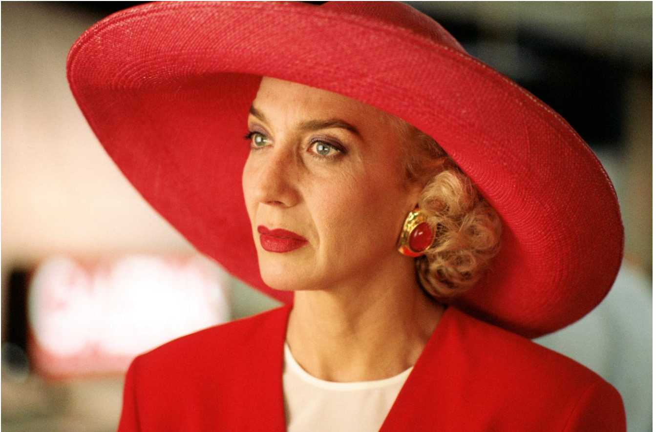
Tacchi a spillo_Marisa Paredes_Foto di Mimmo Cattarinich © El Deseo

Cast Victoria Abril, Marisa Paredes, Miguel Bosé Scritto e diretto da Pedro Almodóvar PER TUTTI n. 87481 del 05/02/1992