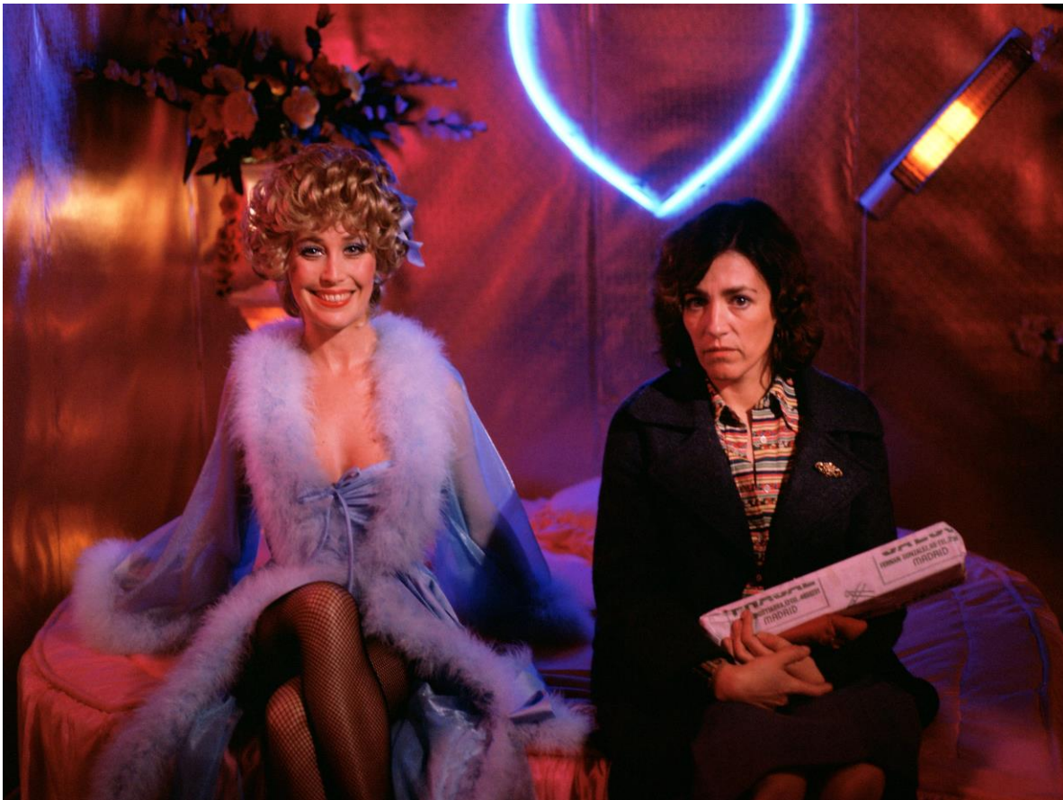
Che ho fatto io per meritare questo_Verónica Forqué e Carmen Maura_ Foto di Antonio de Benito © El Deseo

(¿Qué he hecho yo para merecer esto?) 1984