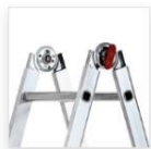
Cerniera in acciaio